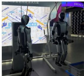
【写真】ヒューマノイドロボット