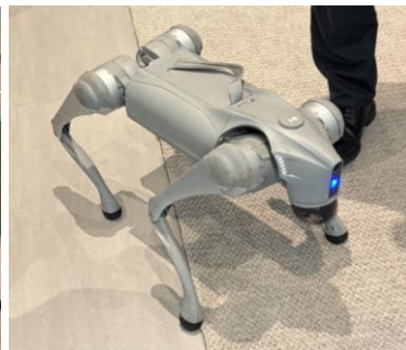
【写真】左:山善(深圳)オフィス、右:犬型ロボット